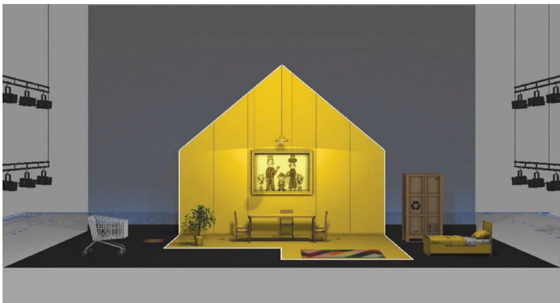
Scénographie de Bruno de Lavenère pour la « pièce de vie »